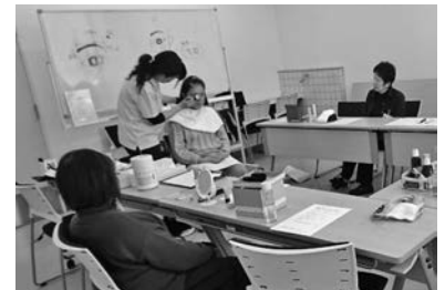
メイクアップ教室