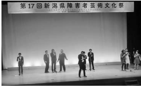
●歌唱 ドリームカレッジレインボー