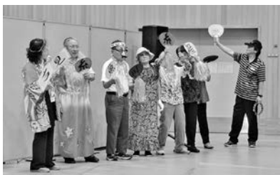
♪ 年々カの入る応援団! 盛り上がり花を添えてくれました♪