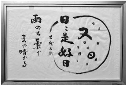
●書道 高松 暁「人生訓」