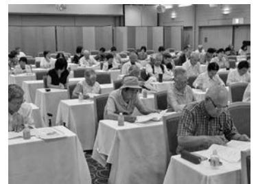
真剣に耳を傾ける参加者