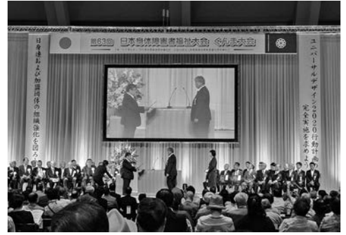
日本身体障害者福祉大会の様子