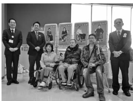
「具体的共感プロジェクト」への参加の様子

多くの方から賛同していただきましたお陰で、予想以上に多額のご支援をいただき、事業実施時に使用するお茶等を購入することが出来ました。イオン六日町店のこの環境・社会貢献事業に大変有難く感じております。当会は今年度も引き続き、イオン六日町店にて「幸せの黄色いレシートキャンペーン」に団体登録しております。毎月11日が「幸せの黄色いレシートキャンペーン」日ですので、イオン六日町店で買い物をする機会がございましたら、当会を応援していただけると嬉しいです。