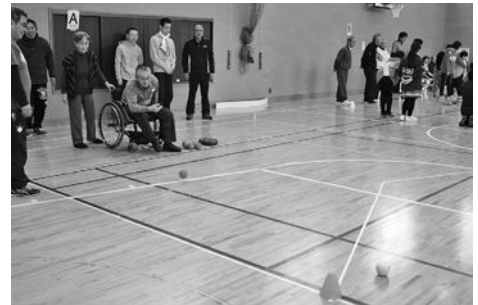
南魚沼郡市ポッチャ交流競技会

当会は、決して大きい会ではありませんが、これからも日々の事業を通じて、様々な関係機関からご協力をいただきながら、市内での「共生社会」を目指した活動を行って参りたい所存です。