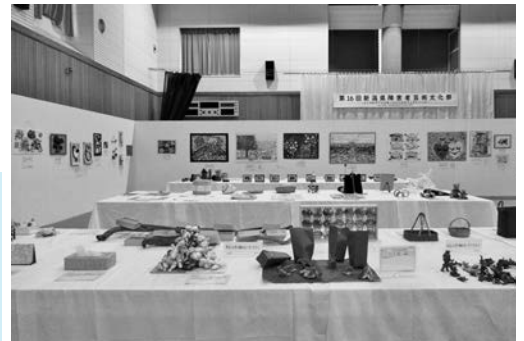
（昨年（平成29年）の美術展の様子）