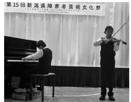
（昨年のステージ発表の様子）