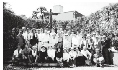
平和の森公園 清掃ボランティア