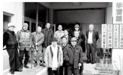
ふるさと学習館(三川地区)

今年は、同じく三川地区の「ふるさと学習館」を見学しました。元小学校を資料館として活用していて、専任講師の案内で回りましたが、型紙を使って切り絵を作成し、恵比寿様や大黒様などの「切り絵教室」の力作が並んでいて感心いたしました。時間がなくてゆっくり見られなくて残念でしたが、玄関で、また来年こようと語り合い、懇親会場への帰途につきました。